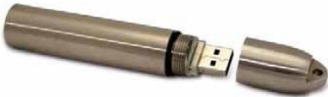
DIMENSIONS All dimensions in mm (inches)

Registrador de temperatura portátil de alta resistencia